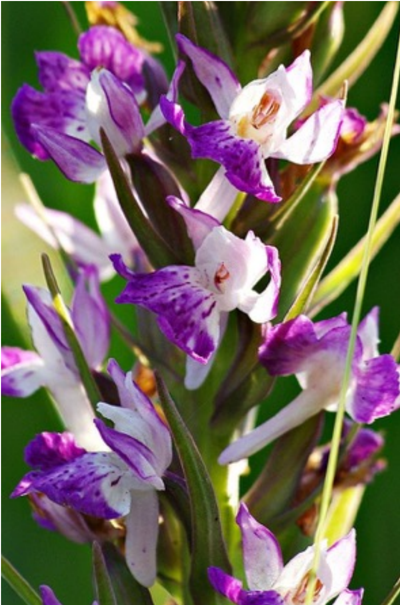
Foto: Dactylodenia st-quintinii

Afgiftekantoor Kortenberg, erkenningsnummer P806150