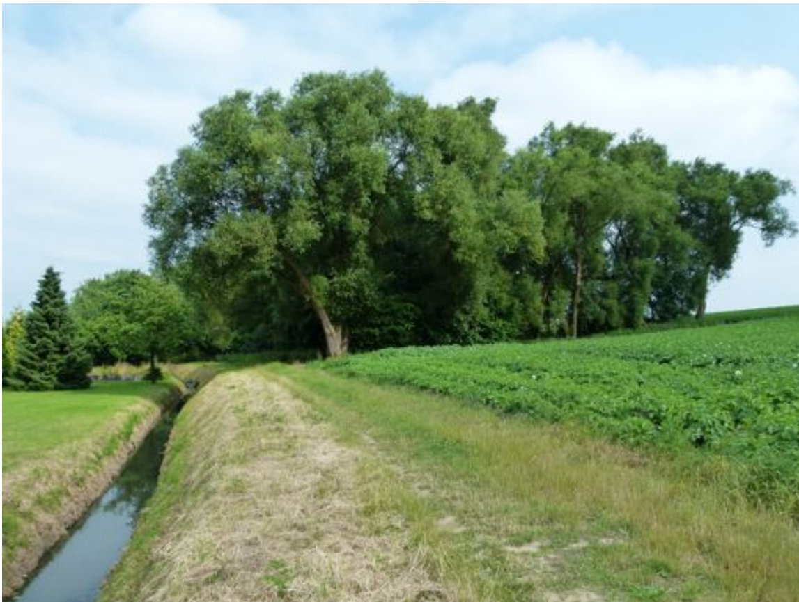
Foto: Kleine beek aan het Imbroek

Afgiftekantoor Kortenberg, erkenningsnummer P806150