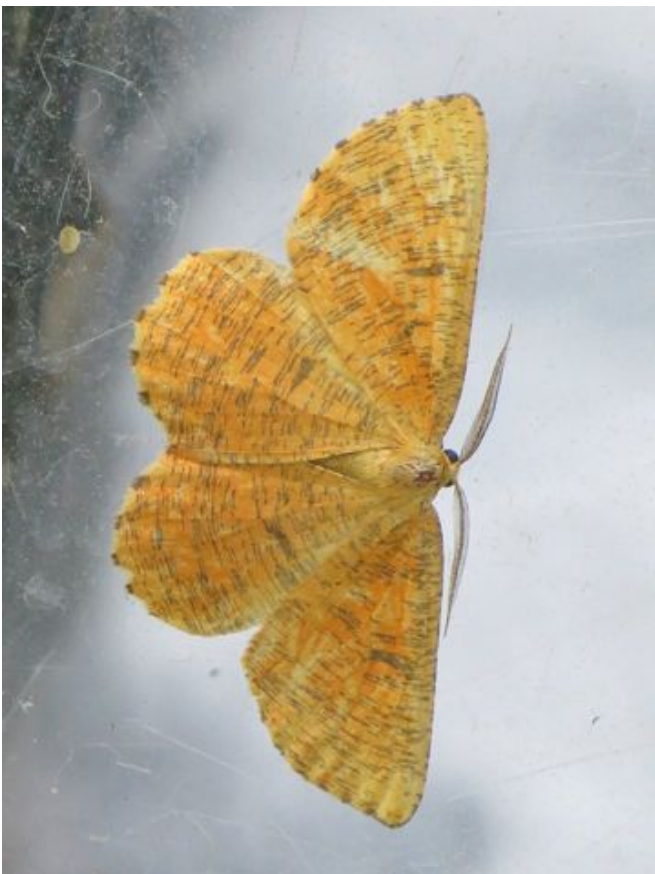
Oranje lepentakvlinder, een van de 113 gevonden soorten...