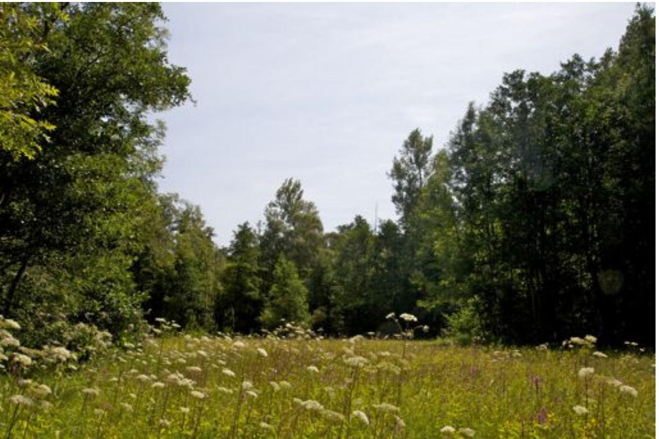
Bomen in het Silsom (augustus 2012, Paul van Leest)