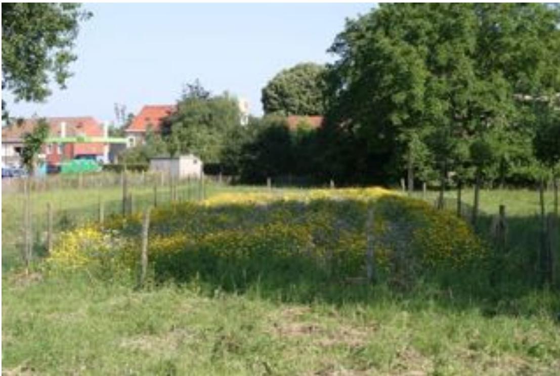
Foto: De bloemenweide tegenover de Colruyt in Nossegem in 2009. Op 12 mei is er een werkdag waarop deze weide weer wordt ingezaaid.

Afgiftekantoor Kortenberg, erkenningsnummer P806150