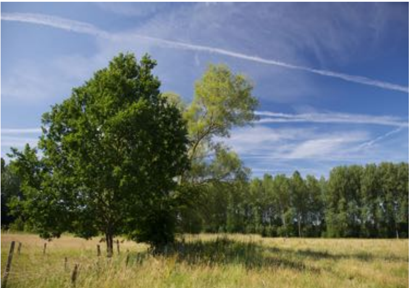
Foto: de Haverbroeken in Meerbeek juni vorig jaar

Gezien de aard van het terrein en de paden zijn de wandelingen niet geschikt voor rolstoelen en kinderwagens. De wandelingen zijn gratis voor leden. Voor niet-leden vragen wij een bijdrage van 1 euro per persoon (maximaal 2,50 euro per gezin). Activiteiten georganiseerd in samenwerking met andere organisaties zijn meestal gratis.