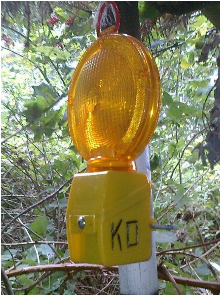
Foto: Gesluikstorte waarschuwingslamp in het natuurgebiedje aan de Kammestraat in Erps-Kwerps (Maarten Vandervelpen)

Afgiftekantoor Kortenberg, erkenningsnummer P806150