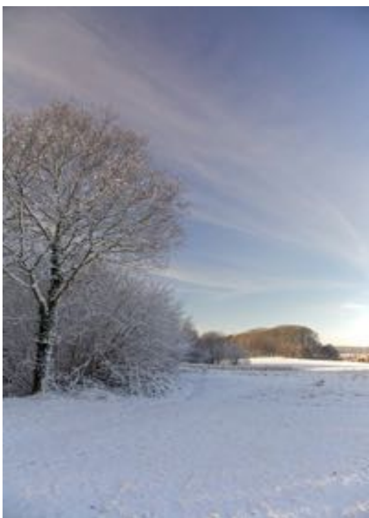
Foto: van de Holleweg naar de achterkant van de Everberg

Afgiftekantoor Kortenberg, erkenningsnummer P806150