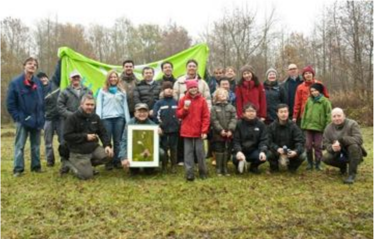
Groepsfoto (Maarten Vandervelpen)

De werkdag werd afgesloten met een groepsfoto voor het archief en de krant, een soepje, een broodje en drank.