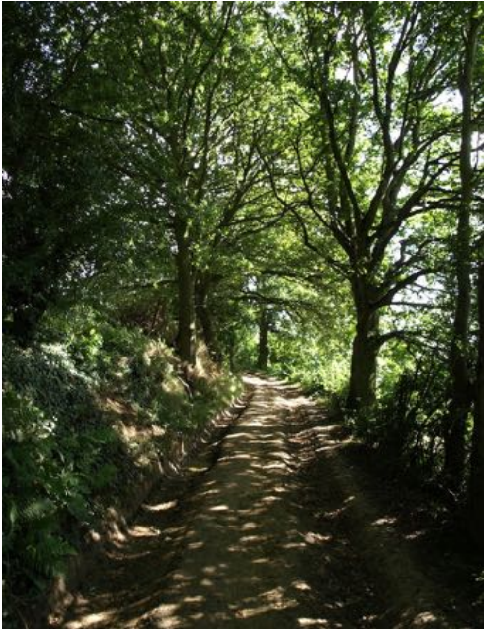
Holle weg in de Koeheide