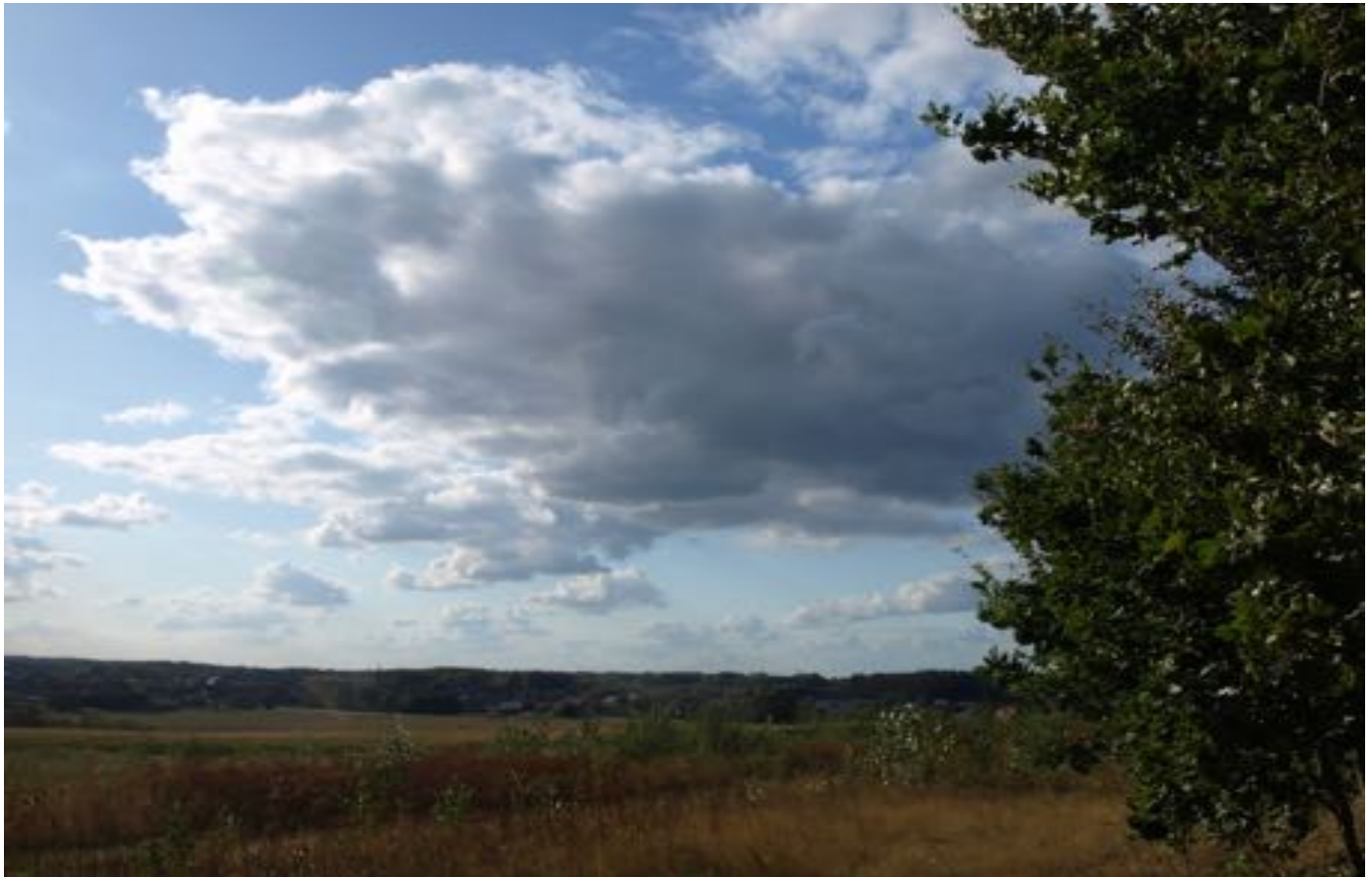
Landschap in de Konnebin in Meerbeek (Paul van Leest)

Omdat wij niet tevreden zijn over dit onduidelijk antwoord hopen wij toch nog met Infrabel een oplossing te vinden. Je kan beter nu vanuit het voorzorgsbeginsel al een eenvoudige maatregel treffen, een zelfklever is immers een kleine moeite. Bovendien, elk jaar is er nieuwe lading jonge vogels die voor het eerst hun omgeving verkennen... Wordt vervolgd!